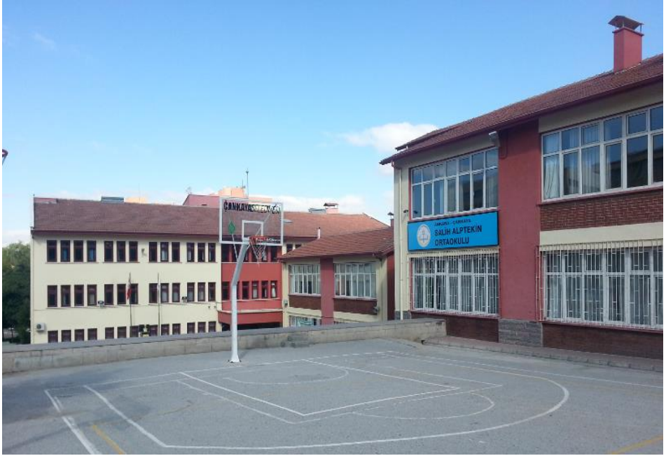
SALİH ALPTEKİN ORTAOKULU